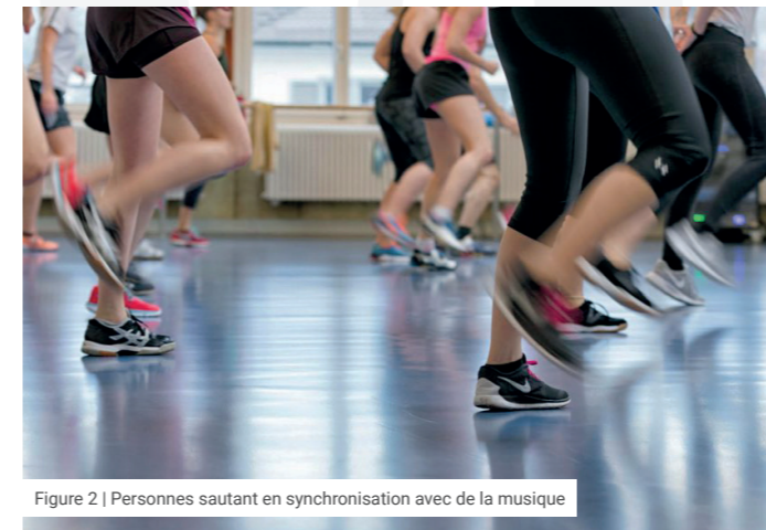
Figure 2 | Personnes sautant en synchronisation avec de la musique

Lorsqu'une personne pose le pied sur un plancher, celui-ci subit un ébranlement de type impulsif. S'il s'agit d'un plancher léger en bois, bois-béton, acier ou acier-béton, cet ébranlement peut être perçu comme désagréable.