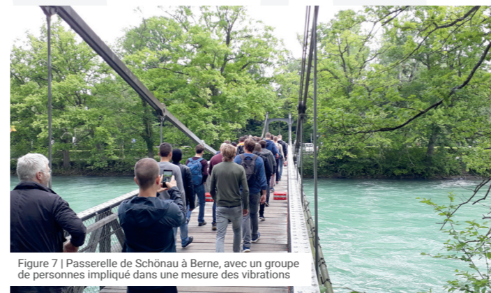
Figure 7 | Passerelle de Schönau à Berne, avec un groupe de personnes impliqué dans une mesure des vibrations

Les problèmes posés par les vibrations et les ébranlements peuvent souvent être évités, ou contrôlés à un prix raisonnable, en agissant sur la conception de l'ouvrage dès le début de son étude. Si les problèmes ne sont identifiés qu'une fois l'ouvrage achevé, ils ne peuvent généralement être résolus qu'à grands frais – pour autant qu'ils soient solubles.