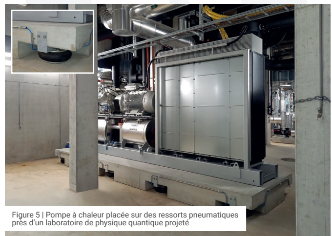
Figure 5 | Pompe à chaleur placée sur des ressorts pneumatiques près d'un laboratoire de physique quantique projeté

Dans les bâtiments de laboratoires, les hôpitaux et les ateliers de finition précise en génie mécanique, des vibrations et des ébranlements minimes suffisent pour perturber des expériences et des processus. Cela s'appelle également aux postes de travail requérant une grande concentration. En sus des ébranlements provenant de l'extérieur, par exemple dus à une voie de communication proche ou à un processus générant de forts ébranlements sur une parcelle voisine, il faut aussi tenir compte de ceux qui proviennent de l'intérieur des bâtiments, notamment imputables à leurs installations, aux ascenseurs ou aux portes. La circulation de personnes et le transport de marchandises à l'interne sont d'autres sources de perturbations.