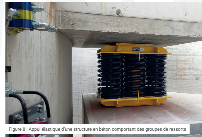
Figure 8 | Appui élastique d'une structure en béton comportant des groupes de ressorts

Les éléments de construction de grande rigidité et inertie sont typiquement moins sujets aux vibrations que les structures légères et élancées. Le choix d'une combinaison judicieuse de rigidité et de masse permet de fixer la fréquence de résonance d'un composant de manière à ce qu'elle soit nettement supérieure ou inférieure à la fréquence de l'excitation générée par la source, ce qui limite l'amplitude des vibrations et des ébranlements. On parle de « réglage haut » ou de « réglage bas » du composant.