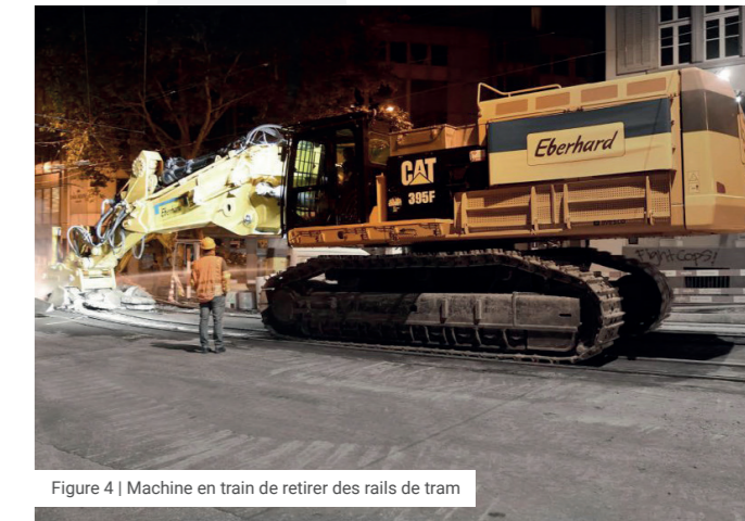
Figure 4 | Machine en train de retirer des rails de tram

Les petits déséquilibres, qui affectent presque toujours les machines comportant des éléments en rotation rapide (tours, fraiseuses, turbines, génératrices, installations équipant des bâtiments ou autres), génèrent des vibrations et des ébranlements qui se propagent dans les bâtiments et dans le terrain de fondation. Ils peuvent produire des bruits solidiens désagréables dans des locaux ou des bâtiments avoisinants.