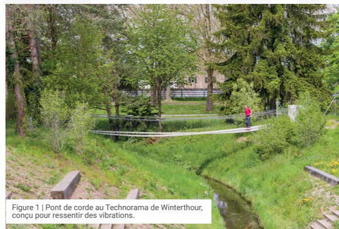
Figure 1 | Pont de corde au Technorama de Winterthour, conçu pour ressentir des vibrations.

Les problèmes posés par les vibrations et les ébranlements sont assez rares, c'est pourquoi le maître de l'ouvrage et les concepteurs ne les identifient souvent que tardivement au cours de l'étude ou lorsque la construction est achevée.