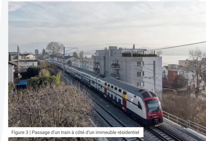
Figure 3 | Passage d'un train à côté d'un immeuble résidentiel

Les lignes de chemin de fer génèrent des émissions qui pénètrent dans le terrain et s'y propagent. Si un bâtiment est situé à proximité d'une voie ferrée (généralement à moins de 30 à 50 mètres) ou au-dessus d'un tunnel ferroviaire, ces émissions sont transmises dans sa structure. Elles peuvent provoquer des ébranlements perceptibles des planchers et générer des bruits solidiens, audibles comme des bruits aériens, à l'intérieur des locaux.