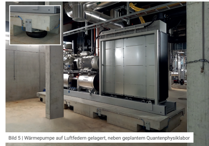
Bild 5 | Wärmepumpe auf Luftfedern gelagert, neben geplantem Quantenphysiklabor

In Laborgebäuden, in Spitälern und in der Präzisionsfertigung im Maschinenbau können schon feinste Schwingungen und Erschütterungen Experimente und Prozesse stören. Dies gilt auch für Arbeitsplätze, bei denen höchste Konzentration erforderlich ist. Neben Umgebungserschütterungen (nahe liegende Verkehrsträger, erschütterungsintensive Prozesse auf Nachbarparzellen usw.) sind gebäudeinterne Erschütterungen, verursacht durch Gebäudetechnikanlagen, Liftanlagen, Türen usw., entsprechend zu beachten. Auch der interne Personenverkehr und Warentransport kann stören.