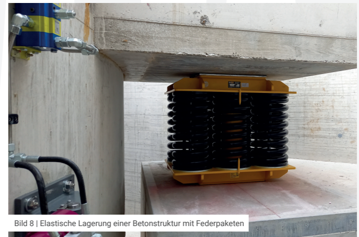
Bild 8 | Elastische Lagerung einer Betonstruktur mit Federpaketen

Bauteile mit grosser Steifigkeit und Massenträgheit sind typischerweise weniger schwingungsanfällig als schlanke leichte Strukturen. Mit einer geschickten Kombination von Steifigkeit und Masse kann die Resonanzfrequenz eines Bauteils so gewählt werden, dass diese klar über oder unter der Anregungsfrequenz der Quelle liegt, wodurch die Schwingungs- und Erschütterungsamplituden begrenzt bleiben. Dies wird als Hoch- bzw. Tiefabstimmung des Bauteils bezeichnet.