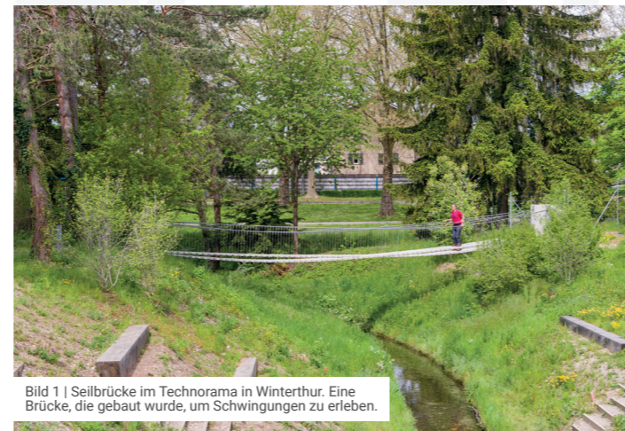
Bild 1 | Seilbrücke im Technorama in Winterthur. Eine Brücke, die gebaut wurde, um Schwingungen zu erleben.

Schwingungs- und Erschütterungsprobleme treten eher selten auf, weshalb Bauherren und Planer diese oft erst spät in der Planungsphase oder aber erst im ausgeführten Bauwerk erkennen.