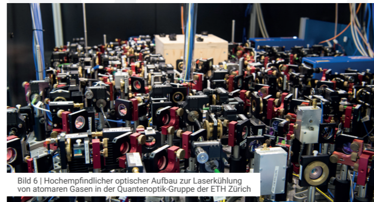
Bild 6 | Hochempfindlicher optischer Aufbau zur Laserkühlung von atomaren Gasen in der Quantenoptik-Gruppe der ETH Zürich

Hochauflösende Mikroskope, Mikrowaagen, Anlagen für bildgebende Verfahren, Teilchenbeschleuniger, Quantencomputer, hochpräzise Schleifmaschinen und weitere Anlagen können äusserst empfindlich auf Erschütterungen von aussen reagieren. Da alle diese Geräte eigene spezielle Aufbauten haben und somit alle unterschiedlich auf externe Erschütterungen reagieren, sind allgemeine Beurteilungskriterien oft unzureichend. Es sind gerätespezifische Anforderungen notwendig, um die Anfälligkeit auf Erschütterungen zu beurteilen. Entscheidend sind neben der Amplitude die Richtung, die massgebenden Frequenzen sowie die Einwirkungsdauer und die zeitliche Veränderung der Erschütterung (kontinuierlich oder impulsartig).