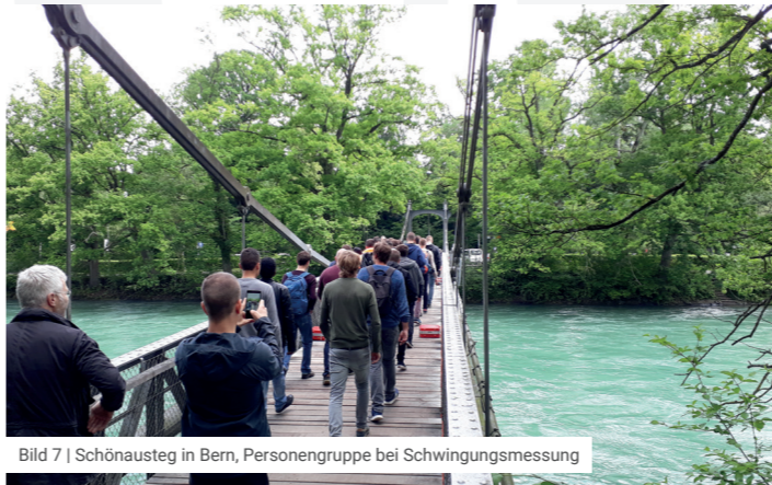
Bild 7 | Schönausteg in Bern, Personengruppe bei Schwingungsmessung

Schwingungs- und Erschütterungsprobleme können in einer frühen Planungsphase oft konzeptionell vermieden oder mit überschaubarem Aufwand kontrolliert werden. Werden die Probleme erst im erstellten Bauwerk erkannt, sind sie meist nur noch mit unverhältnismässig grossem Aufwand oder gar nicht mehr zu lösen.